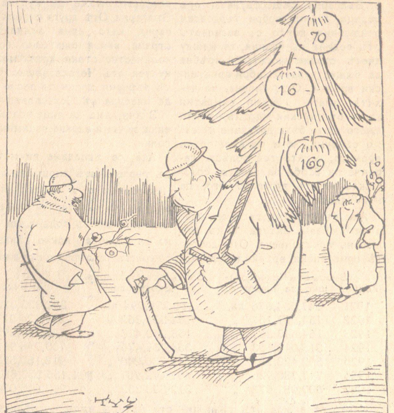
Г-нь Ляпчевъ: Презъ 1929 година математичитъ въ България трѣба да докажатъ, че числата 16 и 70 сж по голѣми отъ 169!