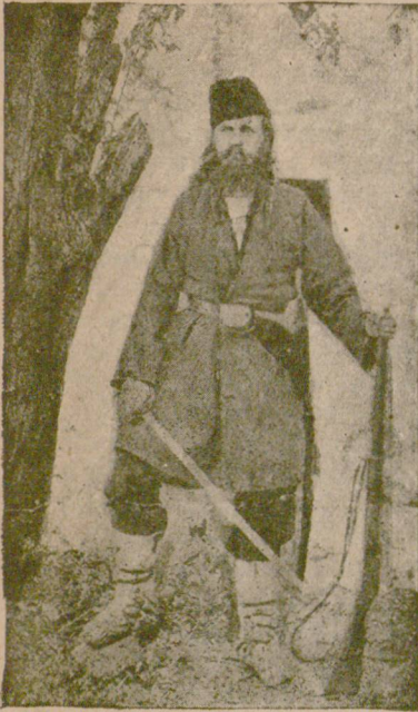
Жълтишки воевода † 1925 г.