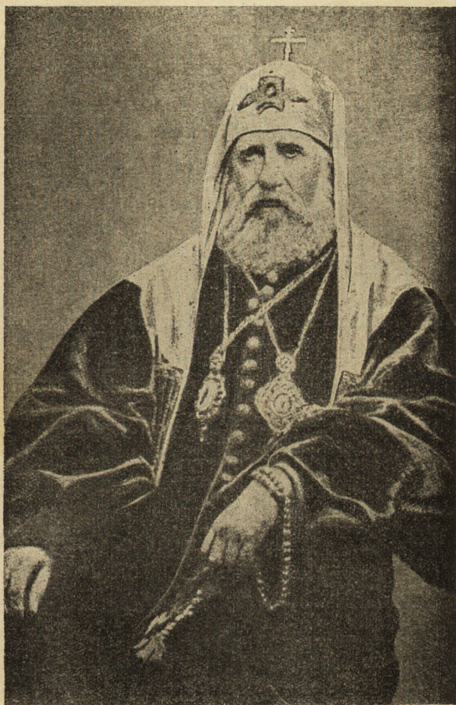
Великиятъ светителъ на Руската Църква † ПАТРИАРХЪ ТИХОНЪ, починалъ на 7 априлъ т. г.

НАР. БИБЛИОТЕКА - ТЪРНАВО ДЕПОЗИТНИ 1926.....г. М3334