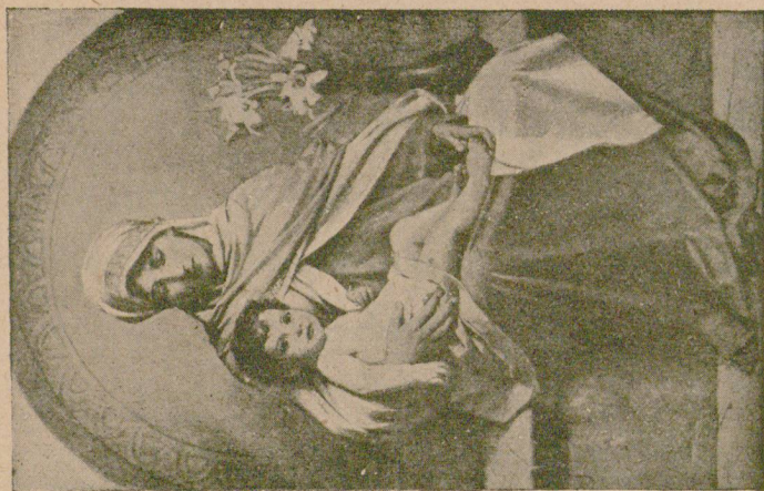
Изъ религиознѣхъ карти и на „Бѣлая крѣсть“.