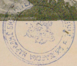
„Той възкръсна — няма Го тука“! Мар. 16, 6.