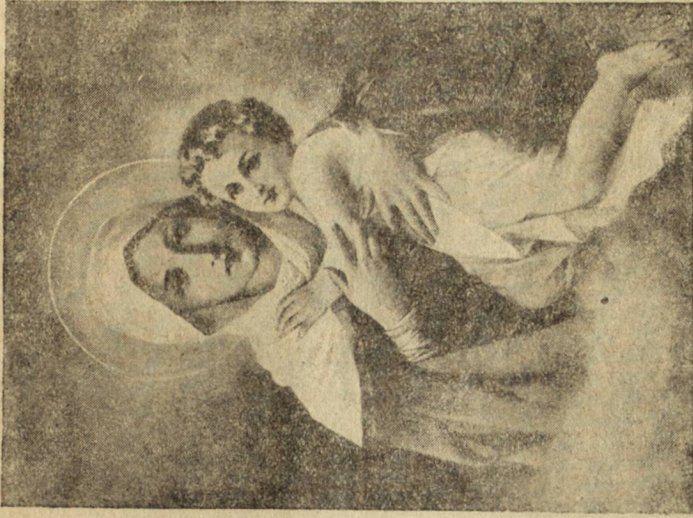
Богоматерь съ прѣдвѣчния Младенецъ