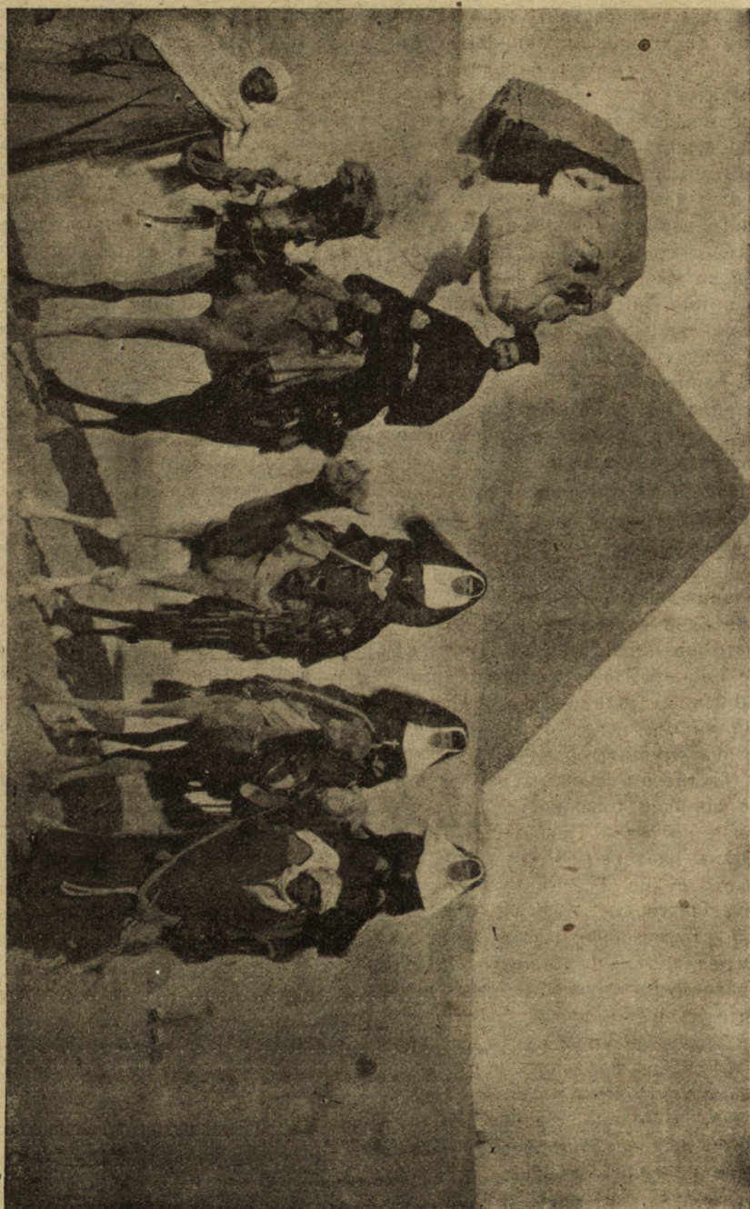
☒ Сестри на „Бълия Кръсть“ въ Египетъ.