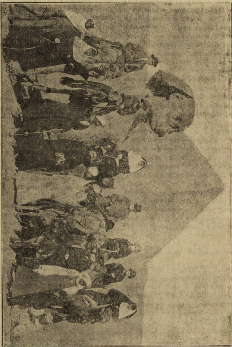
Сестри на „Бълия Кръстъ“, придружени отъ едно английско сѣмейство прѣдъ сфинкса и Хеопсовата пи- рамида до Кайро (Египетъ).