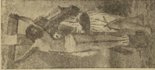
Страдание съ Христа