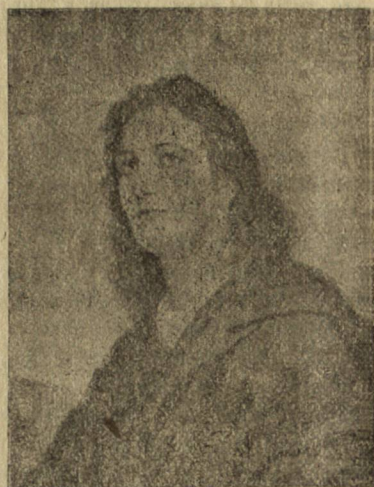
Картина отъ Х. Хофманъ