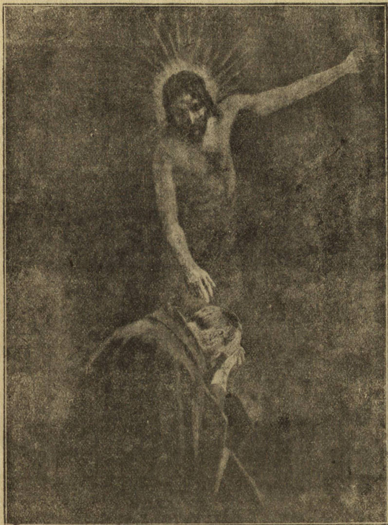
П. СТАКЕВИЧЪ. — ЧУТА МОЛИТВА.