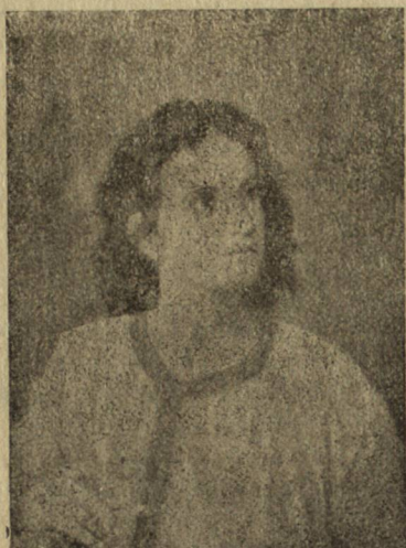
♦ Картина отъ Х. Хофманъ