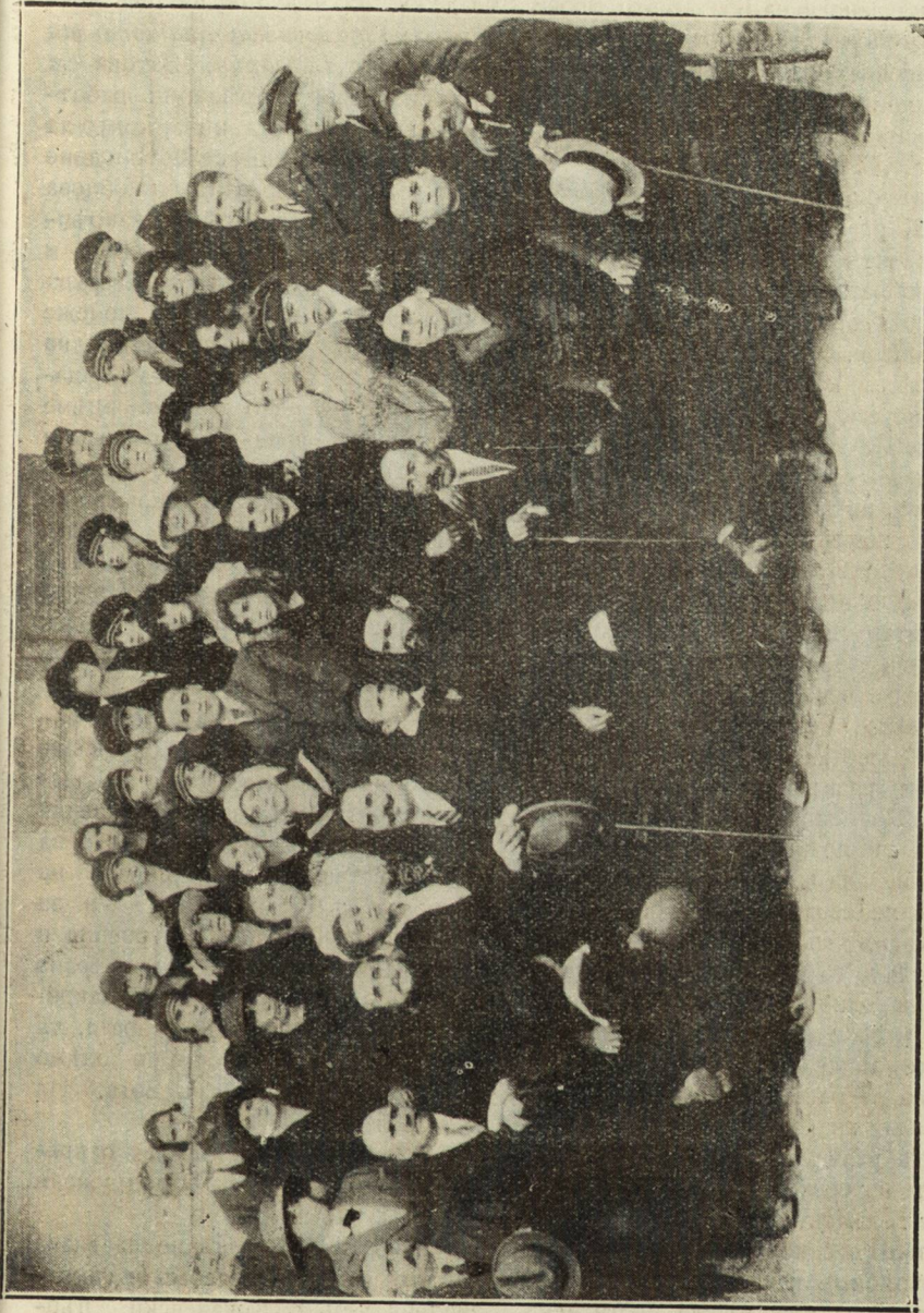
Група на младежите при христ. правосл. побратворно просвѣтно братство „Св. Параскева“ въ София на екскурзия въ Кюстендилъ начело съ духовникъ си ржководители и църковното настоятелство. Тукъ сж прѣдставители на Кюстендилското братство и общинската власть, за които е дума въ статията.