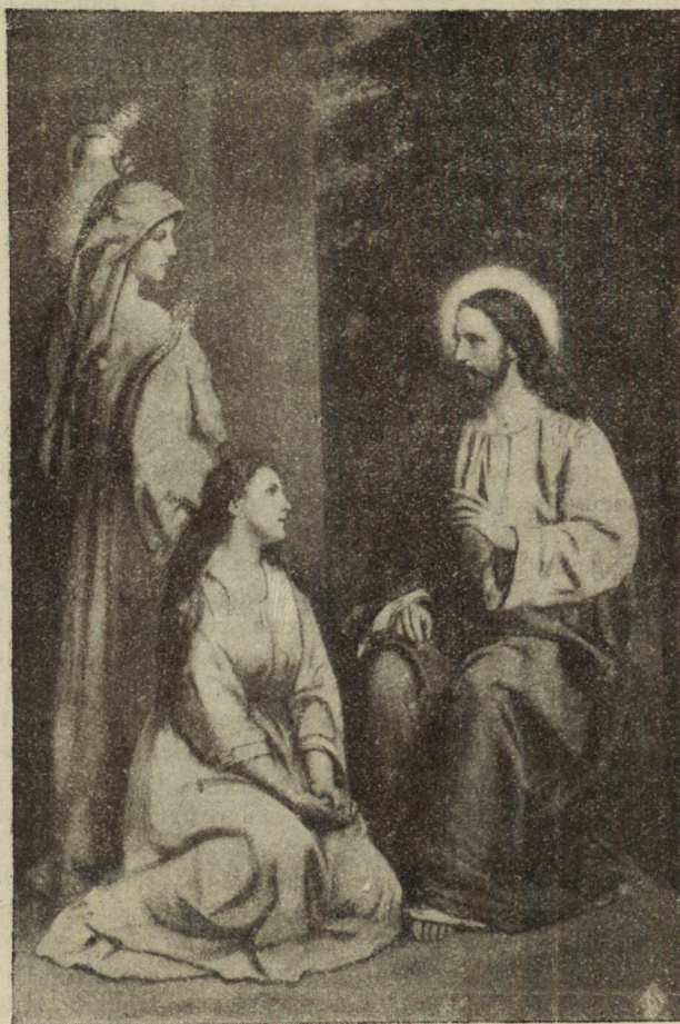
Мария избра най-добрата часть.

и по възрастни, макаръ и негодни за работа, сестри, останали безъ свои близки (обаче имащи материални сръдства, съ които тѣ биха