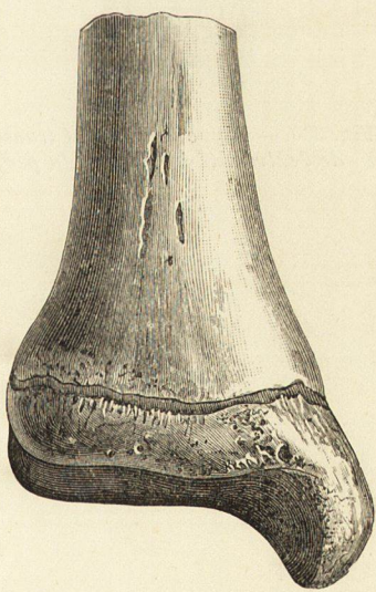
Fig. 325. — Ligne diaphyso-épiphyseaire de l'extrémité inférieure du tibia. — Face antérieure.