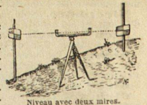
Niveau avec deux mires.

nocturne. adj. 2 g. Qui arrive pendant la nuit. || Se dit des animaux qui veillent la nuit, et des fleurs qui ne s'ouvrent que dans l'obscurité. || Liturg. SM. Se dit d'une partie de l'office de la nuit. || Romance à deux voix qui est d'un caractère tendre et plaintif.