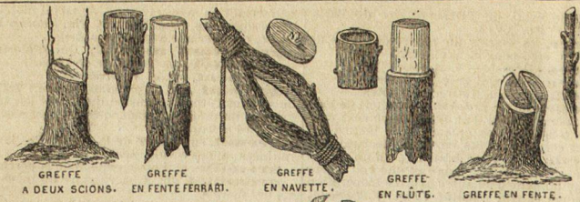
GREFFE A DEUX SCIONS. GREFFE EN FENTE FERRARI. GREFFE EN NAVETTE. GREFFE EN FLÛTE. GREFFE EN FENTE.