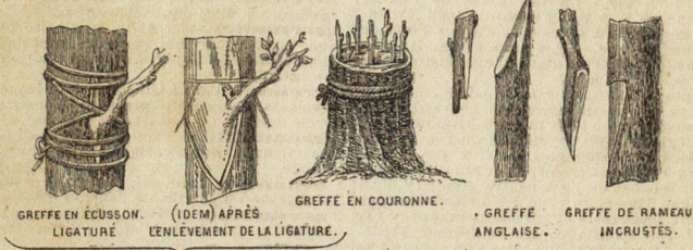
GREFFE EN ÉCUSSON. (IDEM) APRÈS L'ENLÈVEMENT DE LA LIGATURE. GREFFE EN COURONNE. GREFFE ANGLAISE. GREFFE DE RAMEAUX INCRUSTÉS.