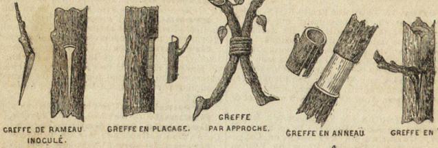
GREFFE DE RAMEAU INOCULÉ. GREFFE EN PLACAGE. GREFFE PAR APPROCHE. GREFFE EN ANNEAU. GREFFE EN T.