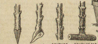
BOUTURE PAR PLANÇON. BOUTURE PAR TALON. BOUTURE PAR RAMEAU. BOUTURE PAR CROSSETTE.