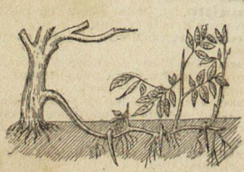
MARQUOTES SIMPLES OU EN ARCHET.