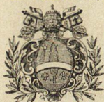
Armoiries de Léon XIII.

arracher. va. (l. ab-radigare ; de radix , racine.) Fig. Détacher avec effort. Obtenir avec