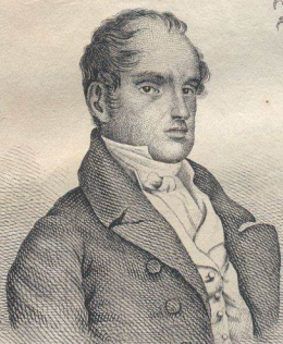
В. Е. Априловъ.