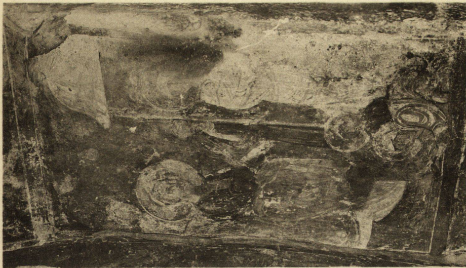
Носенето на кръста (№ 32). Le Portement de la Croix (№ 32).