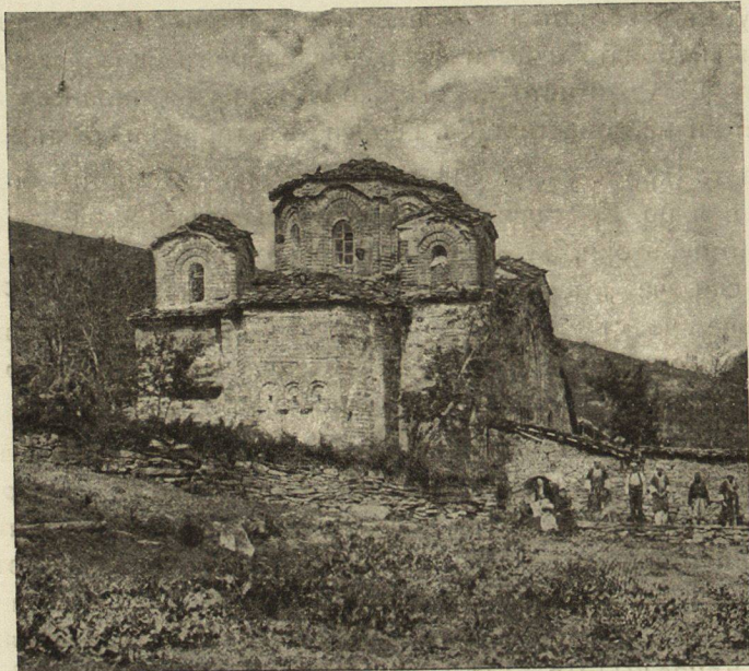
Обр. 332. Нерѣзи. Св. Пантелеймонъ.

почти като кюстендилска махала е старото с. Колуша, чието име се свързва съ названието Коласия 5) на Велбждъ — Кюстендилъ.