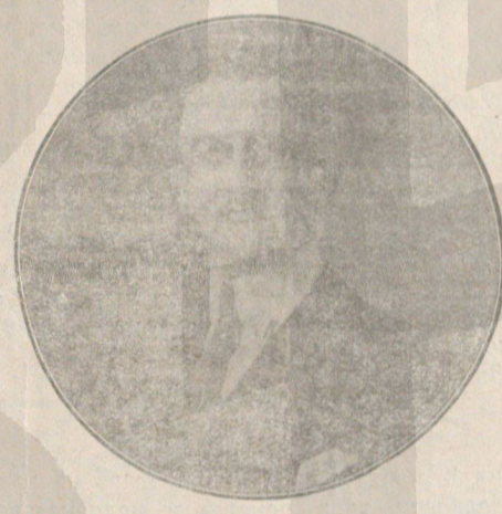
г. Георгъ Брандесъ.

Българския народъ изживя едно дълго робство — време, достатъчно да укрепи у него оная робска психология, която виждаме и днесъ да затруднява културния му полетъ. По едно унаследено отъ това време убеждение, ние продължаваме РЕВНИВО ДА КРИЕМЪ половата проблема отъ очитъ на всички — най-вече младитъ. Като не правимъ на тѣхъ достояние въпроситъ изъ половата областъ, ние претендираме да ги предпазваме отъ прегрешения. Една дълбоко посадена въ душата ни свѣнъ затруднява родители и учители, когато случатъ или работата поставятъ тия въпроси. Въ повечето случаи еднитъ и другитъ ловко отбѣгватъ отговора. Най-после, невежеството по половитъ въпроси е голѣмо и непреодолимо поради оная КРИВО ПОСТАВЕНА СРАМЕЖЛИВОСТЪ, която — като заключва въ китайски стени проблемата, анатемосва едва ли не като „велико престѣпление“ всѣки опитъ да се разкрие тя. Отъ друга страна природата поставя въпроситъ всѣкому. Въ критическата възраст вътрешниятъ миръ на юноша е заетъ изключително отъ тия въпроси. Природата тогава реве, кжса, иска! И понеже нашето КЖСОГЛЕДСТВО забранява намѣсата ни, юношитъ сж принудени да получаватъ отговора на онава, което ги вълнува отъ улицата, поради което масово навлизатъ въ житнитъ води на грѣха. Нуженъ е елементаренъ медицински курсъ за всѣки! Нужна е полова просвѣта! Защото, наредъ съ „невиннитъ“ прегрешения на вратата на културния човѣкъ хлѣпа неизмѣнитъ съжтникъ на културата — венеризма. Тия мисли поражда изложбата, уредена въ града ни отъ