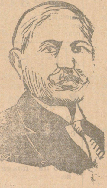
г. М. Мушановъ Досегашниятъ президентъ

поема председателство на Министерския съветъ и министъръ на Външитѣ работи. Досегашниятъ м-ръ на финанситѣ г. Д-ръ Ал. Гиргиновъ става министъръ на Вътр работи. Останалитѣ министри запазватъ портфелитѣ си. Вестъта за заемането отъ сливенецъ поста м-ръ на финанситѣ, въ Сливенъ се посрещна много радостно, и съ право това събитие трѣбва да радва всѣки сливенецъ, защото имената на голѣмитѣ хора въ нашия градъ се увеличиха съ още едно име — съ това на г. Ст. Стефановъ съ високия му постъ и му пожелаваме народополезна законодател-