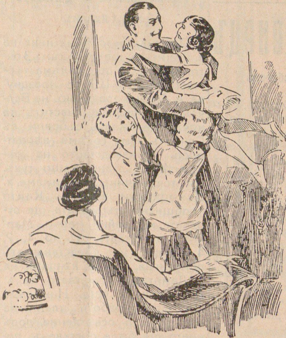
Колона на читателя

Представ.: ШИЛ. ВАСИЛЕВЪ Сливенъ — тел. 88.