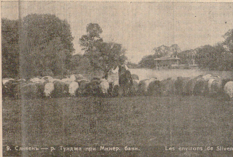
9. Сливенъ — р. Тунджа при Минер. бани.