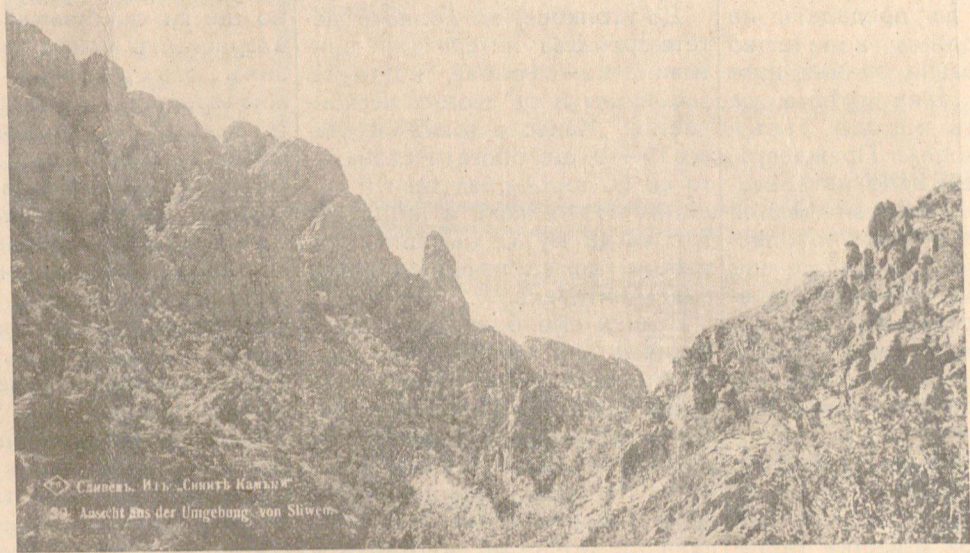
Сливенъ, Изг. „Сливенъ Казанлъкъ“ Изг. Аасехтъ Аис der Umgebunge von Sliven

„Помогни си самъ, да ти помогне и Богъ!“