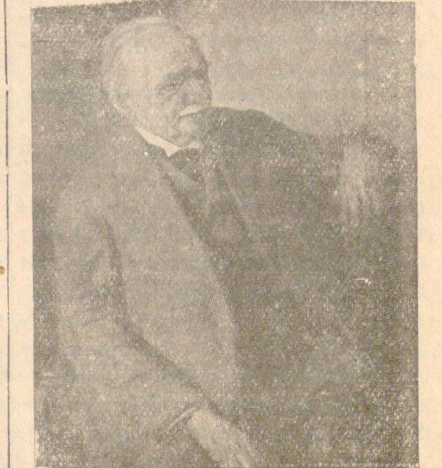
Проф. Йосифъ Ферстръ

Въ това се состои голѣмото значение на Добрева. Много добри сж неговитъ портрети, изпълнени съ лекота, интересни съ строго постигната прилика: нашия композиторъ професоръ Йосифъ Ферстръ, руския художникъ Борисъ Григориѣвъ, бѣлгарския Узуновъ, Петролъ, рускитъ писатели Евг. Чириковъ, Немировичъ — Данченко, бившия пълномощенъ министъръ Б. Вазовъ. Всѣки портретъ е различенъ, защото у всѣки отъ тѣхъ е постигнатъ характера на портретирания, до та-