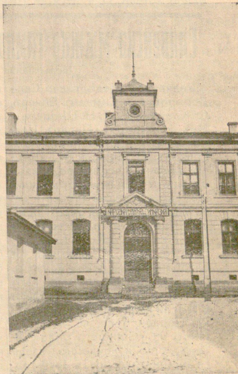
Фасадата на новото здание на мъжката гимназия

Членоветъ на редакциония комитетъ на „Изтокъ“ считатъ за честь и гордость, че сѣ възпитаници на Сливенската мъжка гимназия „Д. П. Чинтуловъ“.