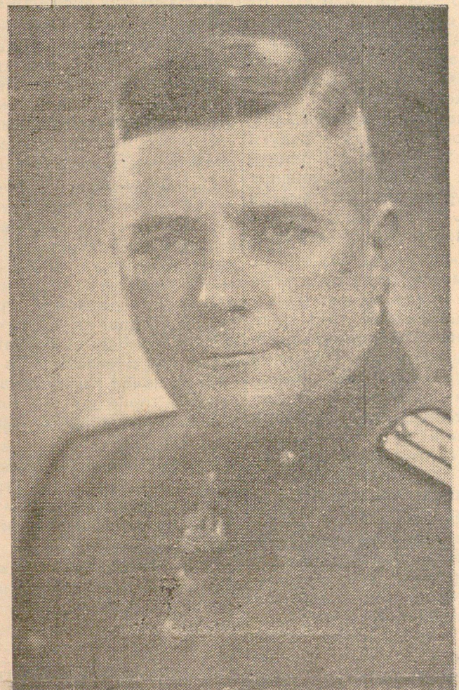
Полковникъ Христо К. Луковъ

Въ сѣбота, предъ претѣленъ салонъ въ читалищъ „Зора“, Н-ка на гарнизона — Пол