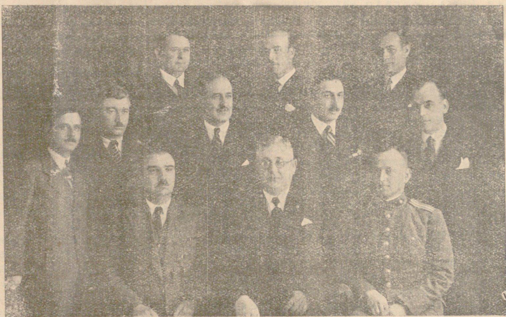
Настоятелството на Слив. културна дружба — Бургазъ

Следъ София, числото на живущитъ и работящи въ Бургазъ сливенци е най-внушително по своя размѣръ. Както всички подбалкански градове, останали безъ поминъчни извори следъ освобождението, така и Сливенъ прокуди голѣма частъ отъ своитъ синове, прѣснати изъ всички краища на страната. И броя на населението на града ни расте, но едновременно съ това расте броя на емигрантитъ — сливенци въ страната въобще.