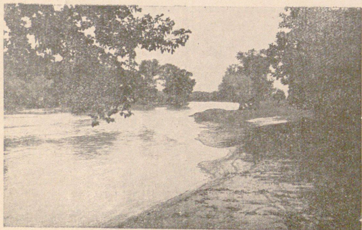
Край Тундна — при банитѣ

Обявления и ренлами за в. „ИЗТОКЪ“ се приематъ въ печатница „БАЛКАНЪ“