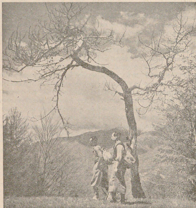
Всрѣдъ роднитъ балкани, където духътъ си отпочива, гѣлото се освежава, а душата се изпълва съ пѣсенята на красотата и величието.

Интереситъ на едно общество и бжджето на единъ градъ трѣбва да бждатъ поставени въ рѣцетъ на хора компетентни волеви, — на тия които работятъ не за свои смѣтки или такива на техни близки и протектета, а за общитъ интереси на града.