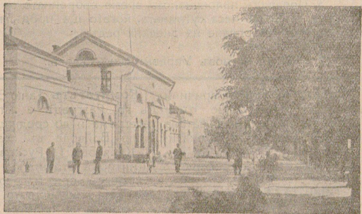
Сливенскитъ минерални бани — известни въ цѣла България сж своята голѣма цѣлбность