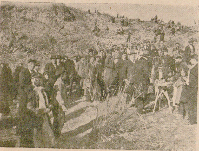
Всѣка година на 22 мартъ — „Св. 40 мъченици“ — Сливенското гражданство масово се отправя къмъ Змеювитъ дупки, въ политъ на Синитъ камъни. Това е единъ истински народенъ празникъ. Тая година, поради хубавото време, въ планината бѣха излѣзли повече отъ 5,000 граждани. Снимката представлява часть отъ излетничитъ.