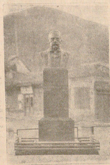
Паметникътъ на Добри Желѣзковъ Фабрикаджия патронъ на Текстиленото училище.