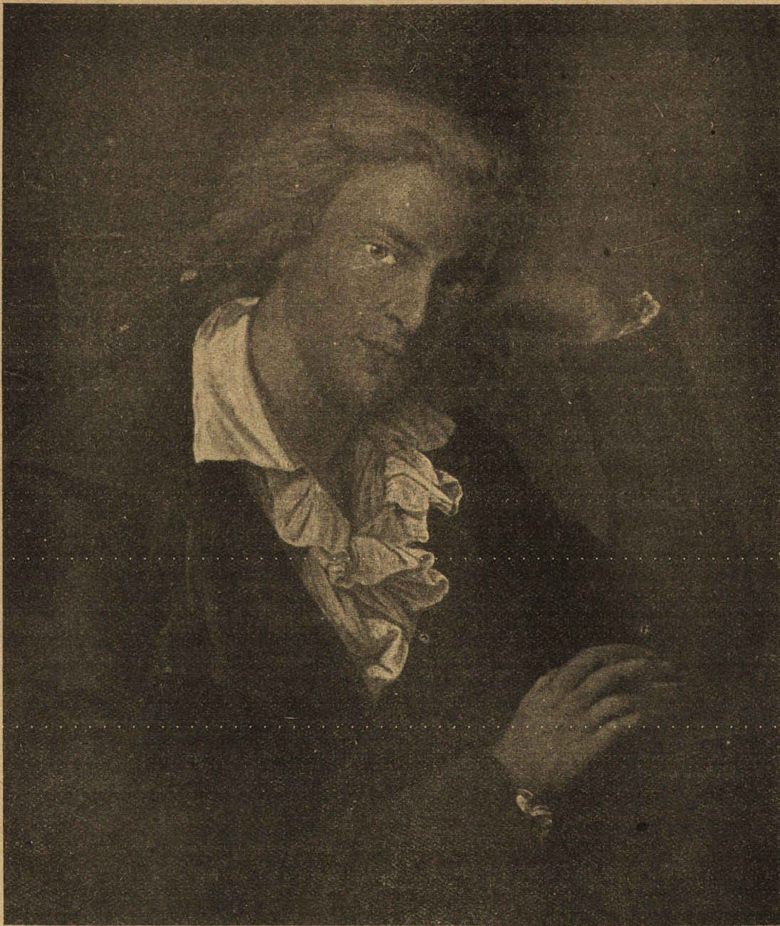
Фридрихъ Шилеръ (1759---1805)

ORGAN DES VERBAND DER SCHAUSPIELER BULCARIENS