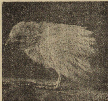
Заболело отъ бълъ поносъ пиле.