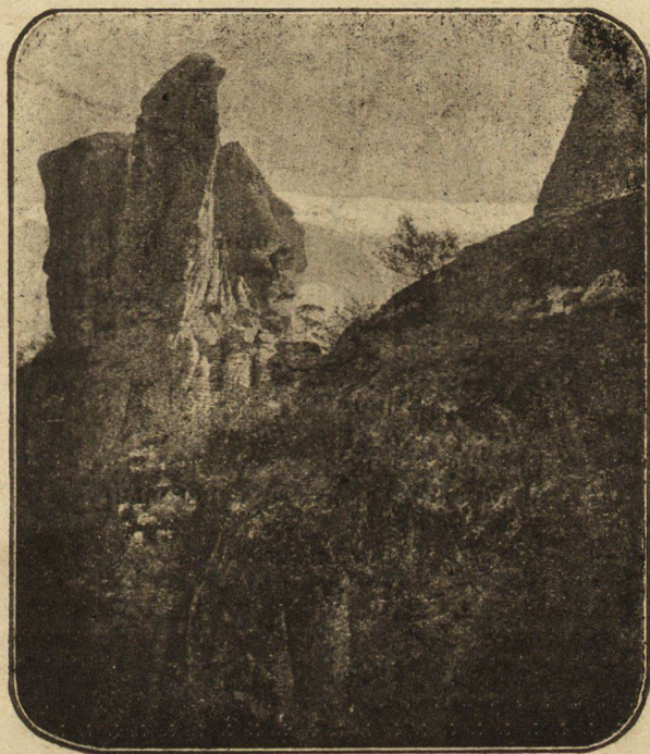
Група скали надъ гр. Бѣлоградчикъ.

Отъ тукъ се отвара красивъ изгледъ къмъ голѣмия Venediger и часть отъ Доломитигъ съ Zankofl. Въ хижата стигаеме въ 10½ часа и закусваме. Слѣдъ малко пристигатъ туристи, които видѣхме, че се изкачватъ слѣдъ насъ, а още слѣдъ малко турист-