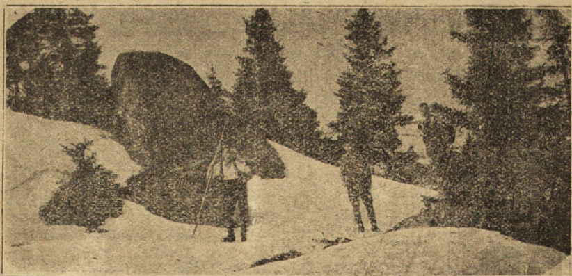
Софиянци на Витоша съ ски вж. Вѣсти.

*) На врѣмето тукъ-тамъ и у насъ се издигаха гласове, впрочемъ може би съвсемъ неправи,—че юношкитѣ два по сходенъ начинъ,—състезанията по съборитѣ имъ,—създавали „панаярджийски артисти“ . . . Авт.