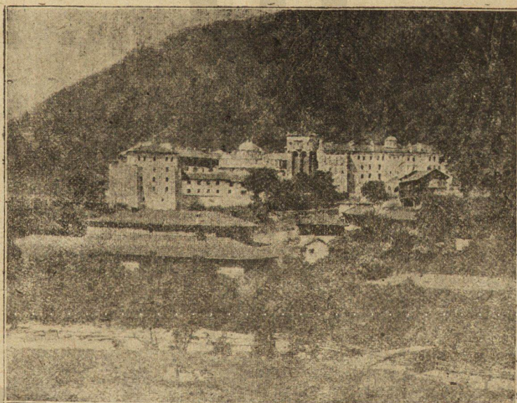
Рилския манастир — външенъ изгледъ.