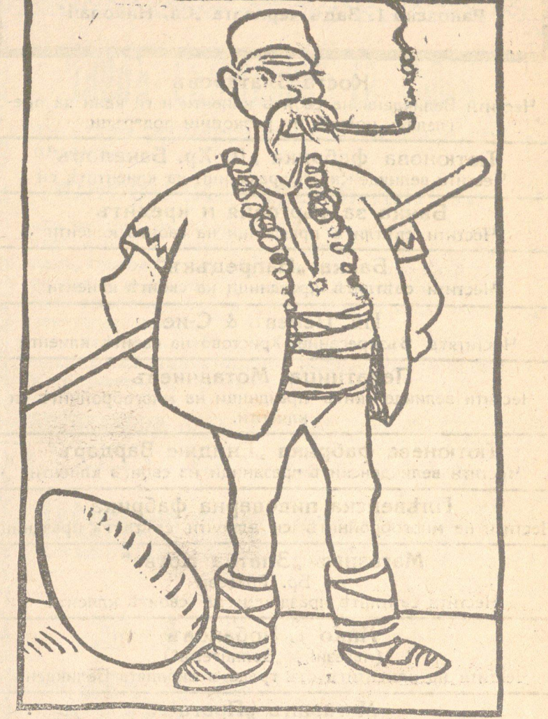
— И тоя Великденъ партийнитъ водачи ще си чукатъ яйцата ама я си знаемъ — масрафа пакъ я че плащамъ...