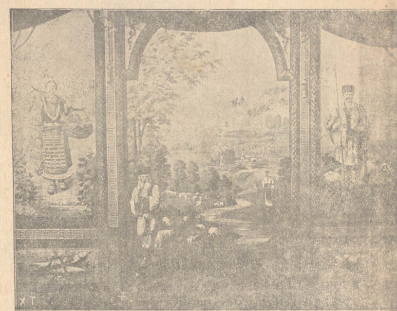
Историческата завеса на сцената на д-во „Съгласие“, работена преди 30 години, унишожена отъ пламъцитѣ на стихийния пожаръ. Прокарва се мнение тая завеса да бжде възтановена и да служи само при тържествени случаи въ новия салонъ.