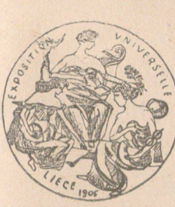
Награденъ съ сребрѣнъ медалъ и дипломъ отъ Лиежкото изложение презъ 1905 год.