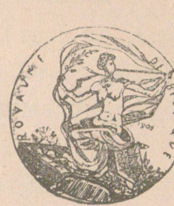
Награденъ съ златѣнъ медалъ и дипломъ отъ Лондонското изложение презъ 1907 год.