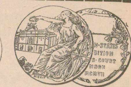
Награденъ съ златѣнъ медалъ и дипломъ отъ Лондонското изложение презъ 1907 год.