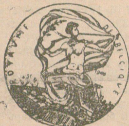
Награденъ съ златѣнъ медалъ и дипломъ отъ Лондонското изложе- ние презъ 1907 год.