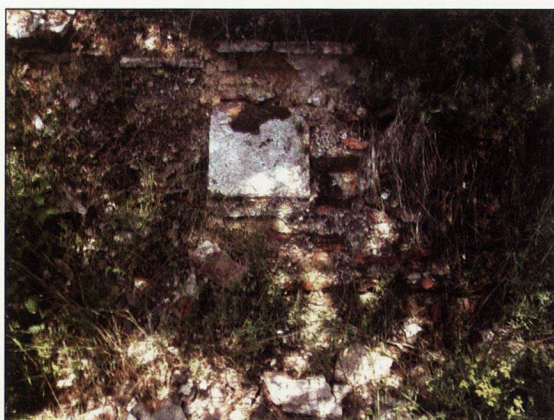
Обр.11 Изглед от останките на защитната кула на крепостта Върло градище. Градежът е изцяло от тухли . Поглед от изток.