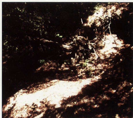
Обр.14. Изглед от карьерата за глина в м. Омайникова поляна под крепостта Върло градище. Поглед от юг.