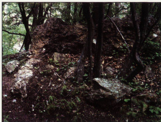
Обр. 15. Изглед на останки на горна камера на пещ за строителна керамика,открита в м. "Омайникова поляна" под крепостта "Върло градище" от юг.