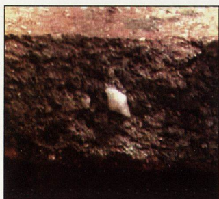
Обр. 13 Кварцово включение в керамиката открита в крепостта Върло градище. Увеличение 50