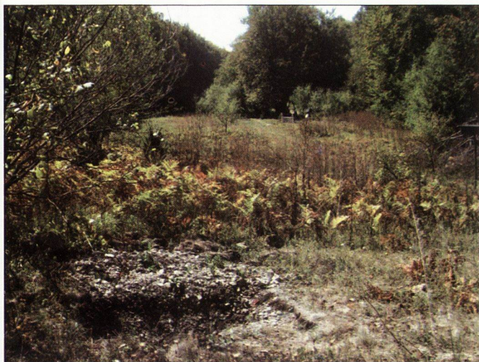
Обр.7. Изглед от речна тераса в горното течение на Равна река, където се откриват останки от кариера за глина и възможен производствен център за строителна керамика. Изглед от север.