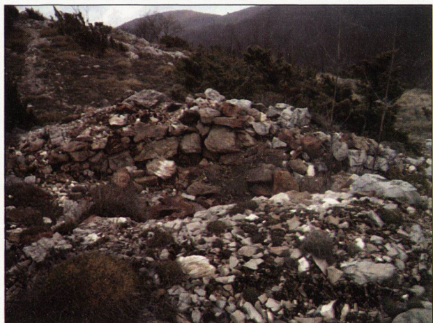
Обр.8. Останки от древна пещ за изпичане на вар, намиращи се на планинското било, северно от крепостта Маричино градище. Наблюдават се останките - рушевина от ломен камък, отчертаваща кръглата основа на пещта.