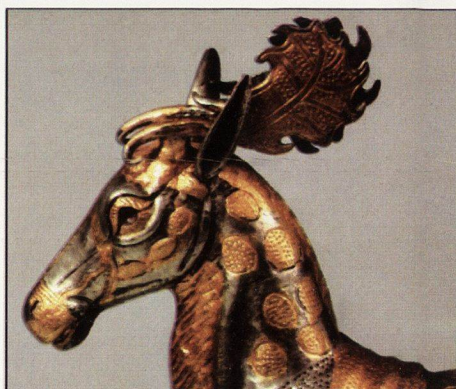
28. Ритон от „Колекция В. Божков“