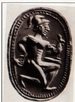
20. Архаична гема