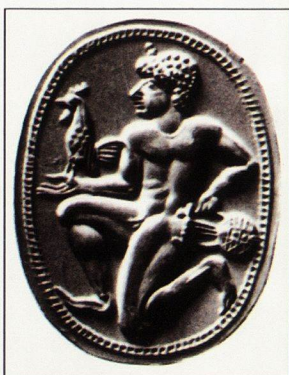
19. Архаична гема