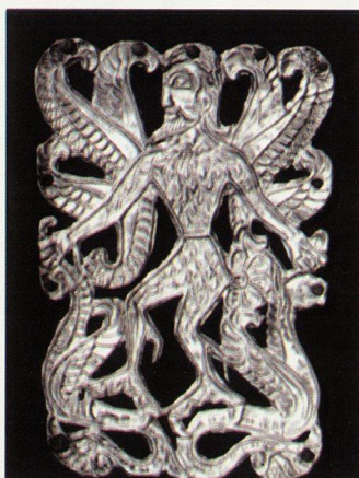
25. Апликация от Бабина могила