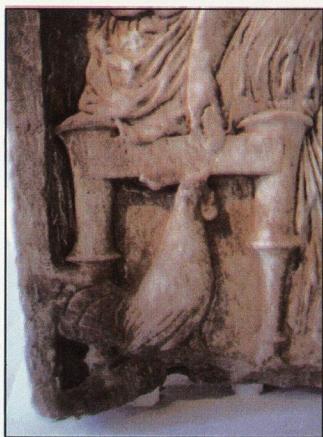
22. Гръцка теракота