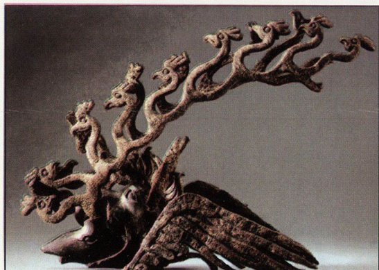
27. „Конска маска“ от Алтай