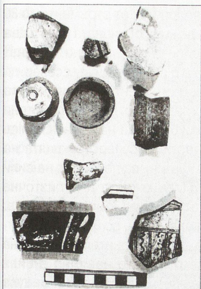
Обр. 5 Крепостта Терзийското кале - северно В м. Камините; фрагменти от късносредновековна българска керамика – тип „сграфито“ ( XIII – XIV в.).

на крепостта. Най – много следи от постройки има върху южните части и на двете укрепления. Удивлява наличието на значителна изкуствено оформена безотточна падина в централната част на външното укрепление, вероятно водоем за поене на коне и добитък.