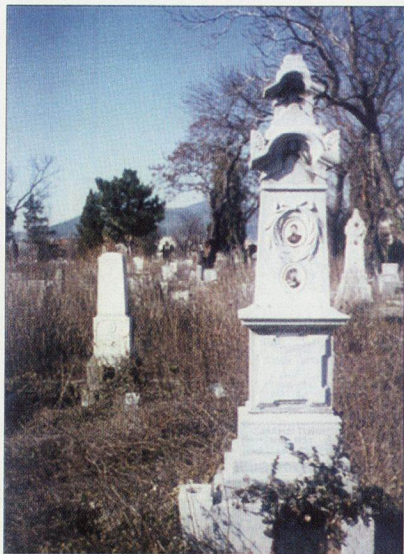
▲ Обелиск от бял мрамор от четири елемента - полк. Тодор Сяров, 1932 г. - Сл.