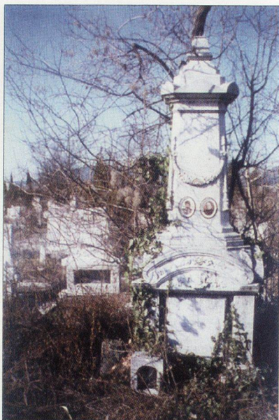
▲ Обелиск от бял мрамор от три елемента на Георги Хр. Гигов, 1915 г. - Сл.