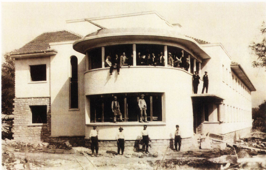
Хотелът на Сливенските минерални бани, 1935 г.