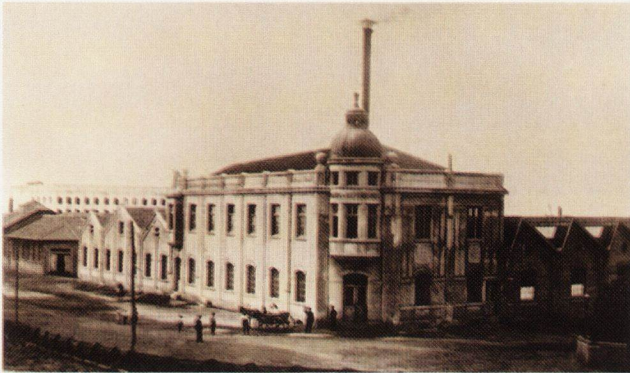
Фабриката за вълнени платове "Недев - Саръиванов" построена през 1909 г.