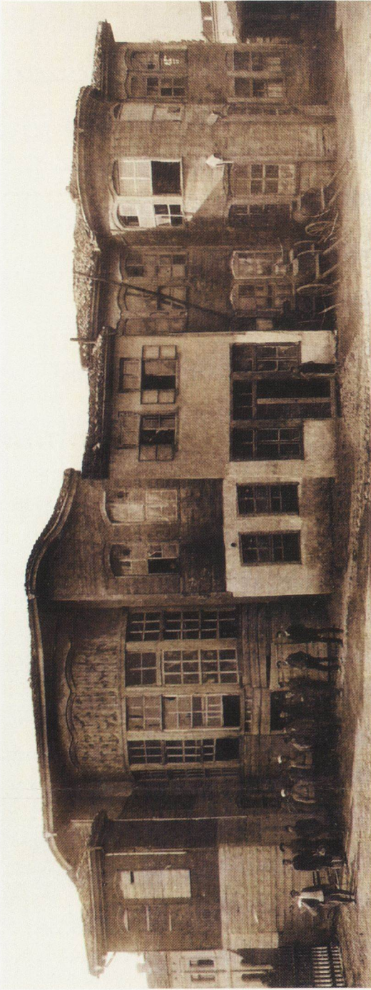
Конакът, където се е помещавала Сливенската община след Освобождението.