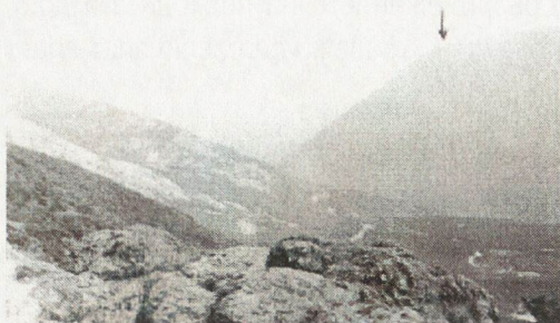
Обр. 1 Южният подход на Ичеренския проход в Сливенската планина и местоположението на наблюдателния пункт в м. Кьошка. /поглед откъм ЮЗ - от наблюдателния пункт на крепостта Орлово гнездо

сочените епохи 16 при вражески нашествия. Защитните пунктове същевременно са били опора на вътрешния ред. В района на крепостите на в. Песченик, Орлово гнездо и Дурешкото кале се е развивала също минна /добиване на руда - хидротермален лимонит 17 и магнетит чрез открит способ и галерии за производство на желязо/ и металургична дейност.