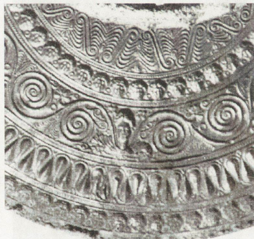
18. Нагръдник от Мезек