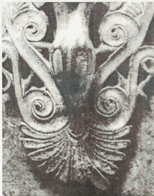
16. Апликация към бронзова хигрия от Руец