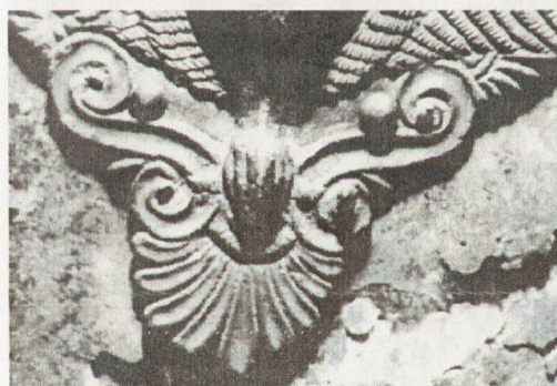
17. Апликация към бронзова хигрия от Махала