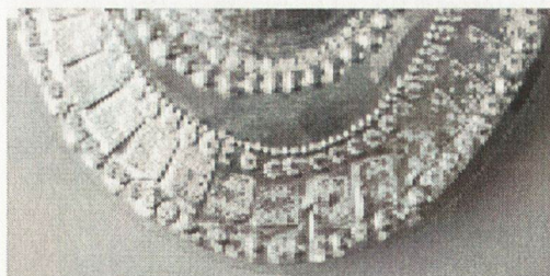
14. Маска от „Колекция В. Божков“, детайл