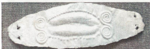
10. „Полумаска“ от Кипър