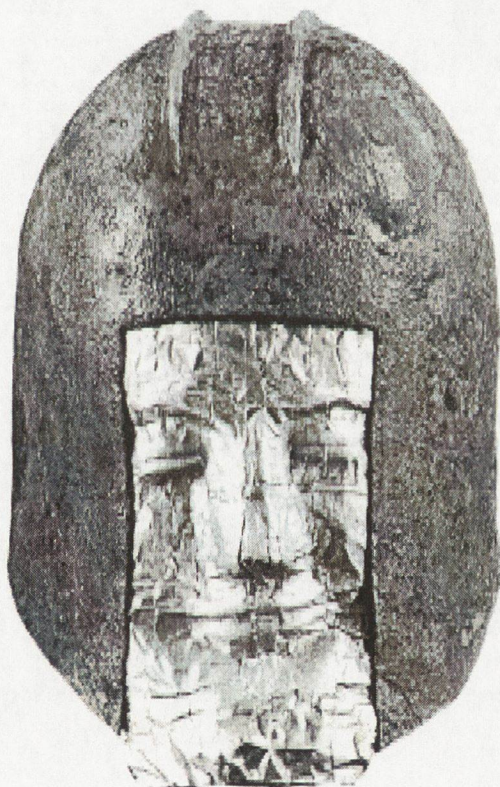
12. Шлем с маска от Синдос