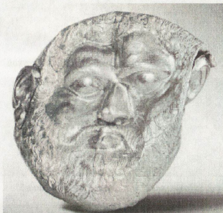
6. Маска от „Светица“