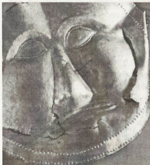
7. Маска от Далакова могила