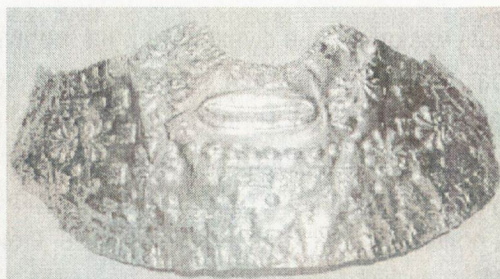
4а. „Полумаска“ от „Колекция В. Божков“