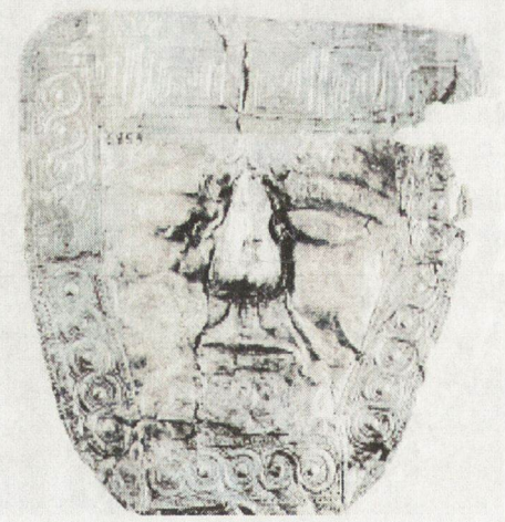
8. Маска от Требенице