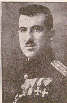
Бано Драгановъ пианистъ