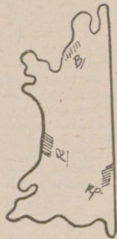
ПОЛОВИНА КОЖА (КАНАТЪ)